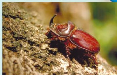
RÉSERVE NATURELLE DE L'ÎLE DE LA PLATIERE