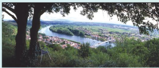
LE PAYS ROUSSILLONNAIS ET L'ÎLE DE LA PLATIERE