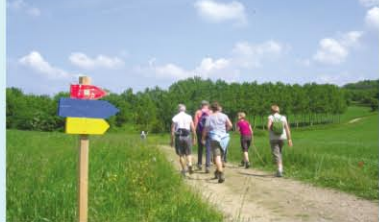
LE PAYS ROUSSILLONNAIS A PIED OU A CHEVAL, LA DÉCOUVERTE AU RENDEZ-VOUS