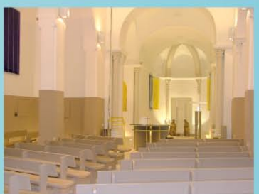
SAINT-PRIM : L'ÉGLISE