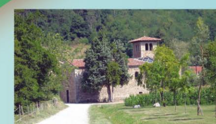
SALAISE-SUR-SANNE - LE PRIEURÉ