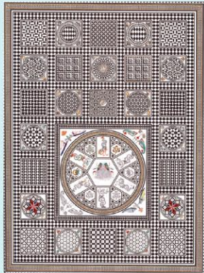
CLONAS-SUR-VAREZE - LA MOSAÏQUE GALLO-ROMAINE