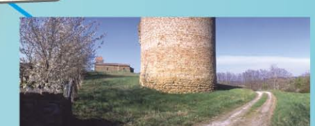
ST-ROMAIN-PE-SURIEU : LA TOUR ET LE PRIEURÉ