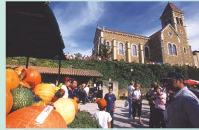
VILLE-SOUS-ANJOU : FÊTE DE LA COURRÈ

Visitez le château Renaissance de Roussillon toute l'année : - les samedis et dimanches à 15 h 30 de septembre à mai et tous les jours à 15 h 30 de juin à août. - sur rendez-vous pour les groupes et les scolaires.