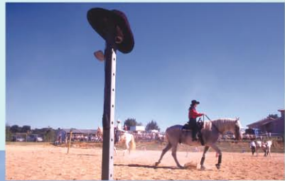
LE PAYS ROUSSILLONNAIS A PIED OU A CHEVAL, LA DÉCOUVERTE AU RENDEZ-VOUS