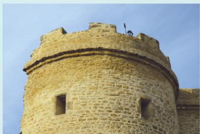
ANJOU : LA TOUR MÉDÉVALE