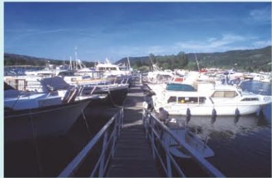
LES ROCHES DE CONDRIEU - LE PORT